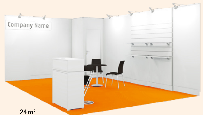
24 m 2