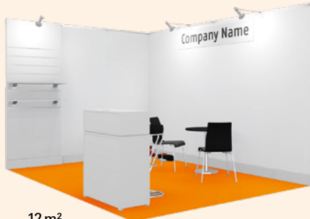
12 m 2