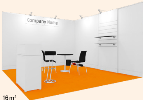
16 m 2